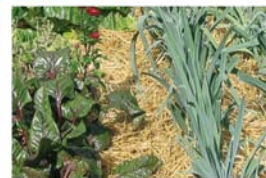
Paillis en paille naturelle