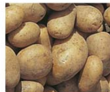
Pommes de terre Émeraude