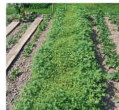
Moutarde utilisée en engrais vert (mois de mai)