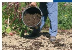
Apport de compost

Tagètes côtoyant des tomates (éliminent les nématodes, vers parasites des racines) et attirent les auxiliaires butineurs.